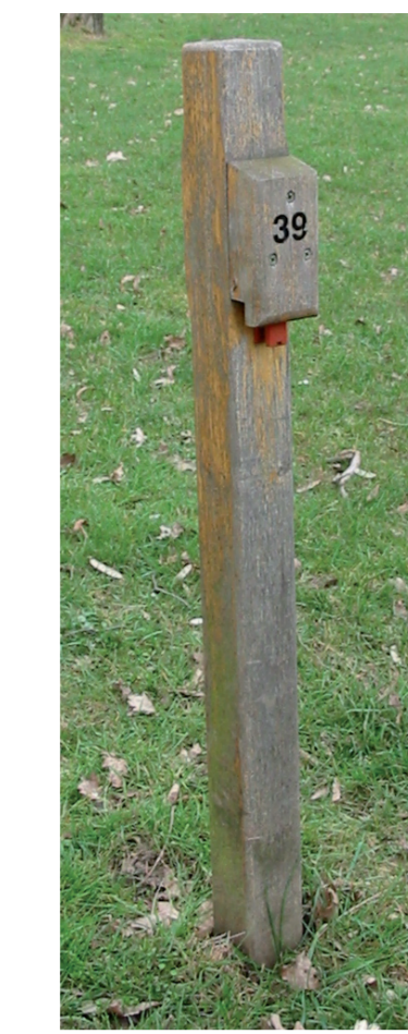
Borne de poinçonnage

C'est une activité sportive en milieu naturel, qui consiste à découvrir des balises (points de contrôle) situées sur le terrain, par le cheminement de son choix, en se servant d'une carte (voir carte ci-contre) et éventuellement d'une boussole. Les balises sont des poteaux en bois avec un numéro (voir photo de la borne de poinçonnage ci-contre) permettant de vérifier si l'on est au bon endroit, et une pince « codée » pour valider le passage à la balise.